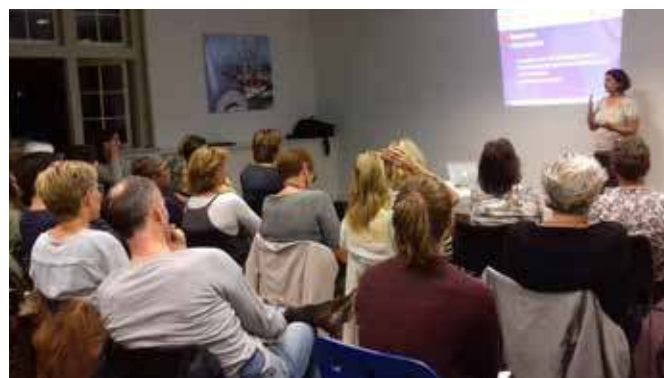
Een themabijeenkomst voor onze vrijwilligers met het onderwerp 'veilig signaleren', die we samen met het Jeugd en Gezinsteam verzorgden.

Tijdens ons contact met ouders hebben we een luisterend oor geboden, met hen meegedacht en hen in contact gebracht met belangrijke instanties in de wijk. Zo brachten we meer dan 53 ouders en hun kinderen in aanraking met de bibliotheek, gidsten we 44 ouders met hun kleintjes naar de peuterspeelzaal, 23 naar de Speel-o-theek en zo'n 35 ouders naar plekken waar ze de Nederlandse taal kunnen leren of oefenen. Ook weten onze ouders nu beter de weg te vinden naar Stichting Leergeld , naar het wijkteam, de zwemvereniging en andere belangrijke voorzieningen in de buurt.