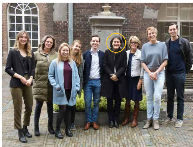
Werkbezoek europarlementariër Kati Piri