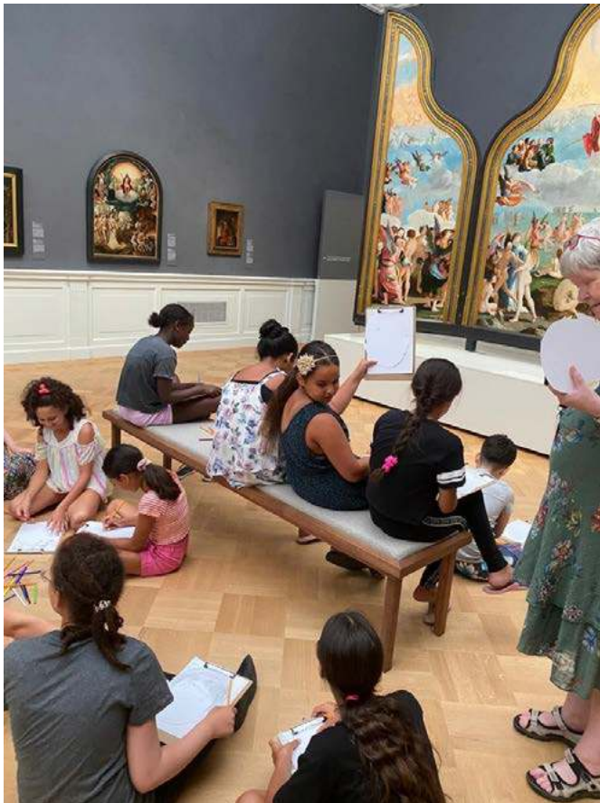
Met de Zomerschool naar de Lakenhal.

#zomerschool #iederkindtaal(vaardig) #iederkindverkentdewereld #iederkindvitaalenvrolijk