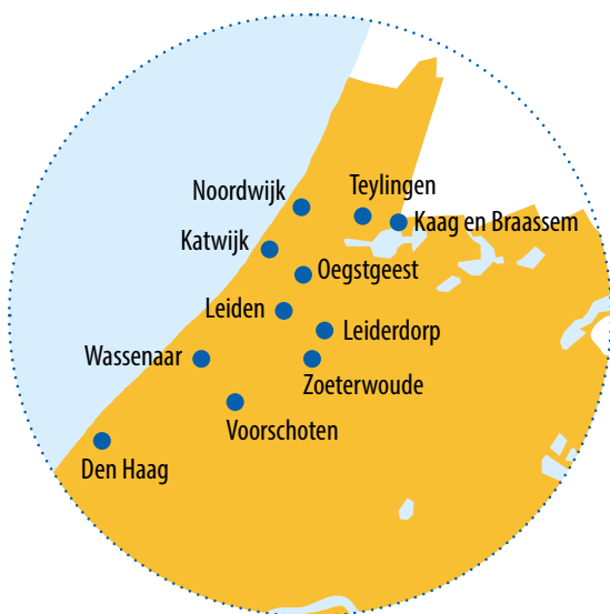
Het aantal deelnemende kinderen dat we bereiken per gemeente – Totaal deelnemers 681