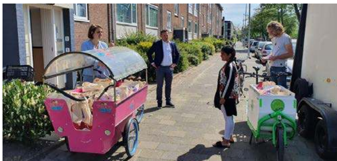
Medewerkers op pad met de tassen. De bakfietsen mochten we lenen van Teddy Kids en Smallsteps.